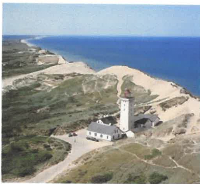
Rubjerg Knude 3. juli 2008

Kom til Rubjerg Knude Fyr 1. oktober 2019 kl. 17.00