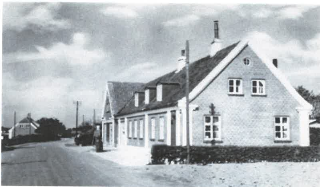
Skallerup Brugs 1950